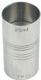
Название продукта : Кодиггер Product Name : Cocktail Measuring

Особенности /Description: 1) Нержавеющий/импортный