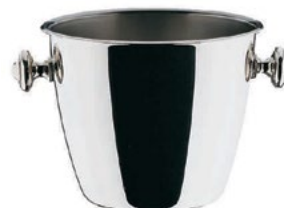
Название продукта : Ведерко для льда Product Name : Ice Bucket Classic