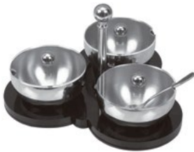
Название продукта : Акриловый стенд для специй, с крышкой Product Name : Spice Case with Cover