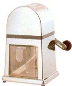
Название продукта: Дробитель льда с хромовым покрытием Product Name : Crame Ice Cracker