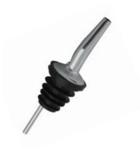
Название продукта : Носик для разлива из бутылок Product Name : Bottle Removal