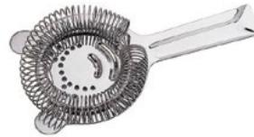
Название продукта : Сито барное Product Name : Bar Strainer