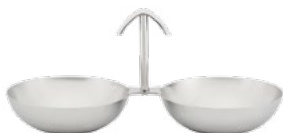
Название продукта : Стальная орешница Product Name : Steel Confectionery