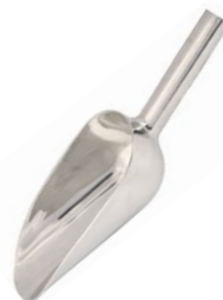
Название продукта : Лопата для льда Product Name : Ice Spoon