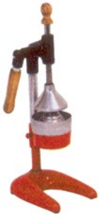
Название продукта : Пресспорт Product Name : Presport