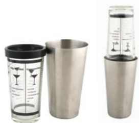
Название продукта : Boston шейкер Product Name : Boston Shaker