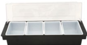
Название продукта : Контейнер для бара Product Name : Bar Container

Особенности /Description: 1) 3 Отсек 2) 4 Отсек 3) 5 Отсек 4) 6 Отсек