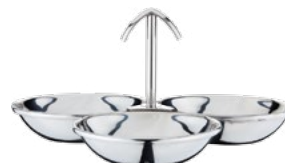
Название продукта : Стальная орешница Product Name : Steel Confectionery