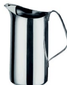
Название продукта : Кувшин для воды Product Name : Water Pitcher