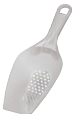
Название продукта : Лопата для льда Product Name : Ice scoop