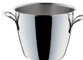
Название продукта : Ведерко для льда Product Name : Ice Bucket Club