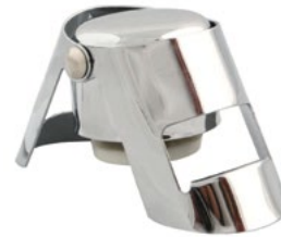
Название продукта : Стоппер для шампанского Product Name : Champagne Stopper

Особенности /Description: 1) двойной ( нержавеющий )