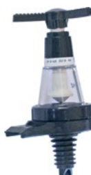
Название продукта : Дозатор для бутылки Product Name : Bottle Shut

Код / Code 1) 0430115 2) 04301151 3) 043011511