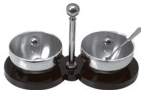
Название продукта : Акриловый стенд для специй, с крышкой Product Name : Spice Case with Cover