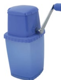
Название продукта : Дробитель льда с хромовым покрытием Product Name : Plastic Ice Cracker