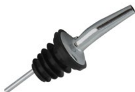
Название продукта : Носик для разлива из бутылок Product Name : Bottle Removal

Особенности /Description: 1) 2.5 cl 2) 4 cl 3) 5 cl