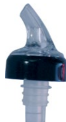
Название продукта : Носик для разлива из бутылок Product Name : Bottle Removal

Особенности /Description: 1) 2.5 cl 2) 3 cl 3) 4 cl 4) 5 cl