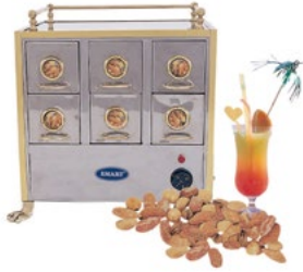
Название продукта : Нагреватель для орешков Product Name : Appetizer Heater