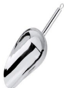
Название продукта : Лопата для льда Product Name : Ice Spoon