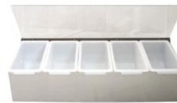
Название продукта: Контейнер для бара Product Name : Bar Container

Особенности /Description: 1) С толстыми отверстиями 2) С тонкими отверстиями