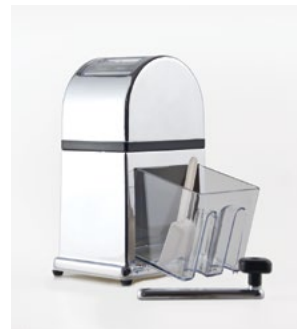
Название продукта : Дробитель льда с хромовым покрытием Product Name : Crame Ice Cracker

Особенности /Description: 1) 3 Отсек 2) 4 Отсек 3) 5 Отсек 4) 6 Отсек