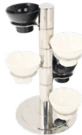
Название продукта : Орешница 5 Отсек Product Name : Relish Stans 5 pieces