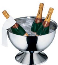
Название продукта : Чаша для пунша Club Product Name : Punch Bowl Club