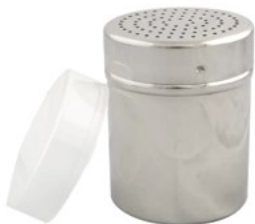
Название продукта : Диспенсер для пудры нержавеющий Product Name : Powder Dispenser