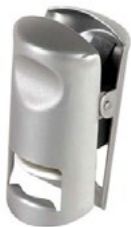
Название продукта : Стоппер для шампанского Product Name : Champagne Stopper