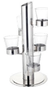
Название продукта : Crudity 5 Отсек Product Name : Stans crudity 5 pieces