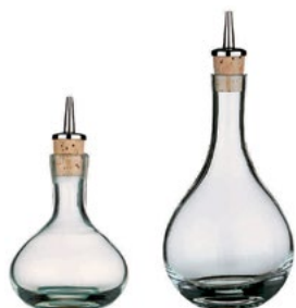
Название продукта : Емкость для масла Product Name : Oil Bottle

Код / Code 1) 009W0671726040 2) 009W0671716040