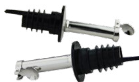
Название продукта: Металлический носик разливатель ,с крышкой 2-ная Product Name : Oil Removal