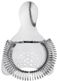
Название продукта : Сито барное Product Name : Bar Strainer