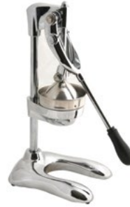
Название продукта : Пресс для фруктов , промышленного типа Product Name : Profesional Fruit Press

Особенности /Description: 1) 4и секционный 2) 6и секционный