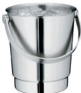
Название продукта : Ведерко для льда Product Name : Ice Bucket Basic