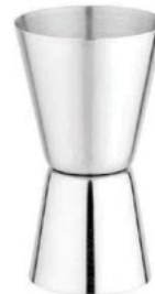
Название продукта : Кодиггер Product Name : Cocktail Measuring

Особенности /Description: 1) 15 / 30 cc 2) 20 / 40 cc 3) 25 / 50 cc