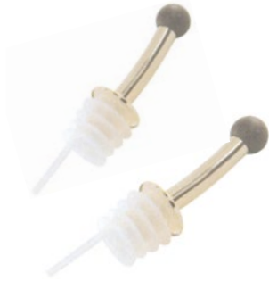
Название продукта : Носик для разлива из бутылок Product Name : Bottle Removal